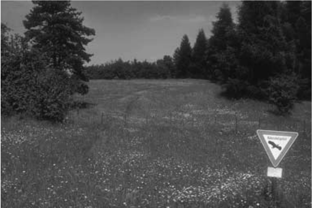
Durch Ausweisung als Naturschutzgebiet sollen sensible Bereiche geschützt werden.