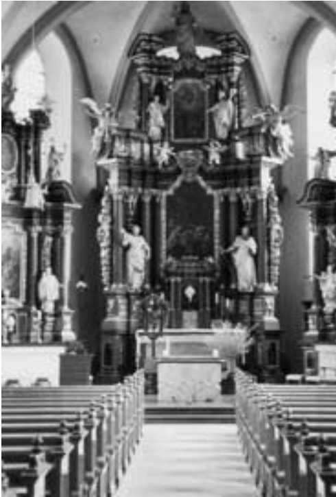
Wehr. Im Inneren der Barockkirche.