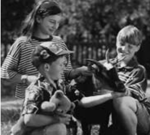
Im Urlaub meckert nur die Ziege – Zufriedene Kinder beim Urlaub auf dem Bauernhof.

ernhof“, aber auch die Zusammenarbeit mit anderen touristischen Leistungsträgern stark fördern. Diese Zusammenarbeit – das an einem Strang ziehen – kommt letztendlich dem Tourismus der gesamten Eifel zugute.