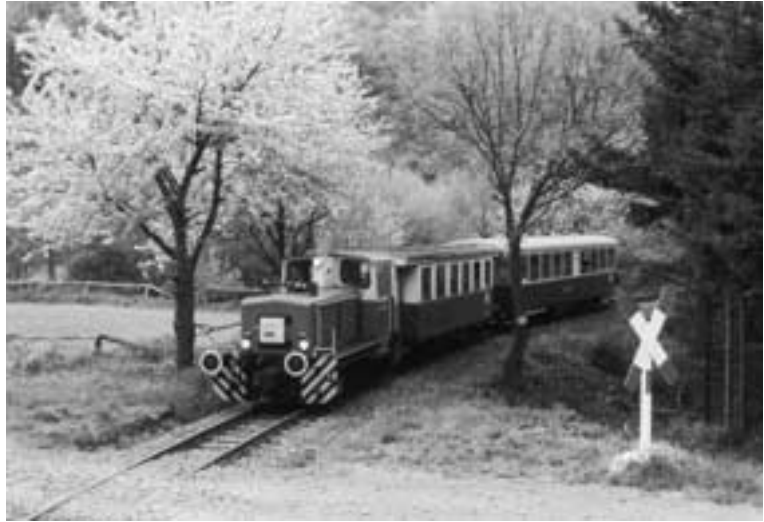
Brenk. Mit der Brohltalbahn in den Frühling.

ger der Region und so galten Dank und Glückwunsch allen, vor allem den Freiwilligen von IBS, die in den vergangenen Jahren ihren Beitrag zu deren Erhalt und Ausbau geleistet haben. Auch der Eifelverein gehörte am Rednerpult zu den Gratulanten.