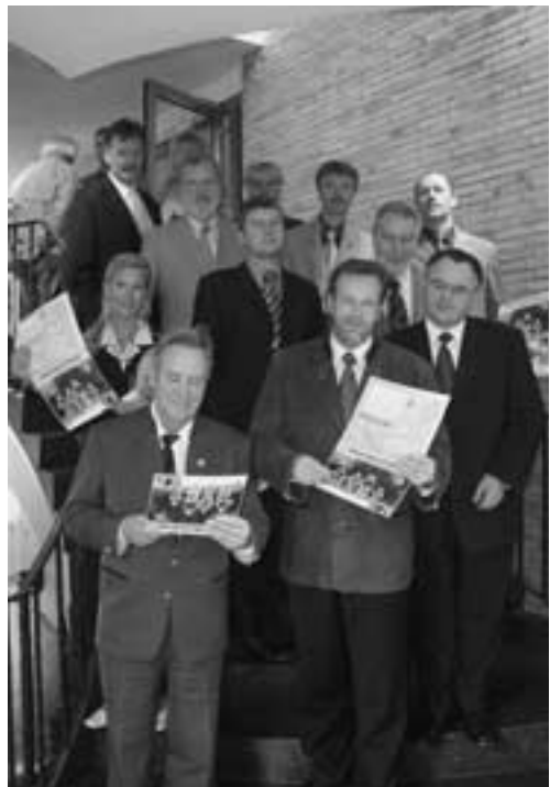
Trier. Großes Interesse zeigten vor allem die Vertreter der Behörden bei der Vorstellung der neuen Radbroschüre.