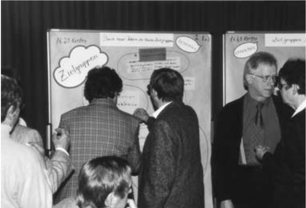
Gerolstein. Jeder arbeitete fleißig mit und brachte seine Ideen und Anregungen ein.