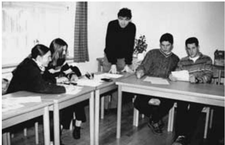
Projektunterricht in der Fachschule.

Diese rasante Entwicklung in allen Bereichen der Landwirtschaft spiegelt sich auch in Lehrbüchern, Studentafeln und Lehrplänen der jeweiligen Zeit wider. So werden zur Zeit der Gründung der Ackerbauschule in Bitburg im Jahre 1873 in den Studentafeln damaliger landwirtschaftlicher Bildungsgänge die Unterrichtsthemen „Bürgerliches Rechnen“ und „Hufbeschlagslehre“ aufgeführt. Aber auch „Geschichte“ und „Geographie“ fanden schon bald