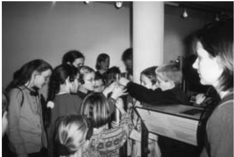
OG Eschweiler. Begeistert erforschten die Kids aus Eschweiler das Deutsche Museum in Bonn

OG Roetgen. Mit mehr als 30 Jungen und Mädchen bot die Jugendgruppe des Eifelvereins einen viel-