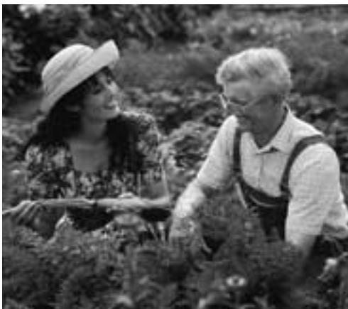
Sehen und Schmecken – frisches Gemüse aus dem Bauerngarten.

Wenn wir die Kernleistung als Hardware bezeichnen, so wissen wir, dass bei Buchungsentscheidungen des Gastes der „Software“ – den so genannten Zusatzleistungen – eine große Bedeutung zukommen. Aus dieser Erkenntnis heraus muss das Ange-