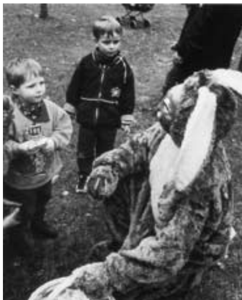
OG Ulmen. Viel Spaß hatten die Kinder mit dem leibhaftigen Osterhasen.