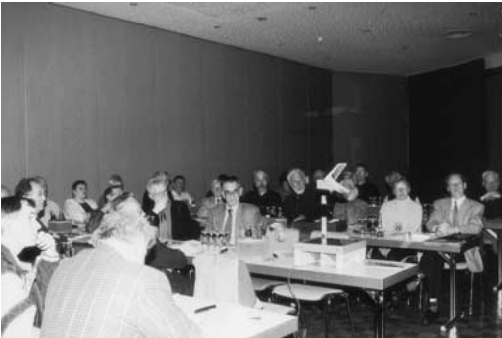
Gerolstein. So wie hier im Arbeitskreis „Kultur“ rauchten in allen vier Workshops die Köpfe der Teilnehmer.

Die Räumlichkeiten in Gerolstein erlaubten die Bildung von vier Arbeitsgruppen (Workshops). Als Themenschwerpunkte legte die Projektgruppe deshalb „Wandern“, „Naturschutz/Landschaftspflege“, „Kulturpflege“ sowie „Jugend- und Familienarbeit“ in