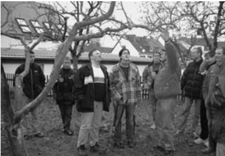
Demonstration des Baumschnitts im Fachschulunterricht.

Der Wandel in der Landwirtschaft der vergangenen 100 Jahre spiegelt sich auch in den Schülerzahlen und in der Entwicklung der landwirtschaftlichen Schulstandorte wider. Gab es im rheinland-pfälzischen Teil der Eifel im Jahre 1950 flächendeckend noch 12 Landwirtschaftsschulen mit jährlich vielen hundert Fachschülern/innen, so konzentriert sich im Jahre 2002 die landwirtschaftliche Fachschulausbildung auf die beiden Schulstandorte der Staatlichen Lehr- und Versuchsanstalt für Landwirtschaft (SLVA) Bitburg/Prüm mit insgesamt 81 Schüler/innen. Besuchten im Schuljahr 1984/85 noch 1013 landwirtschaftliche Auszubildende rheinland-pfälzische Berufsschulen, so sind dies landesweit im Schuljahr 2001/2002 nur mehr 157 Schüler/innen, wobei über 50 % dieser landwirtschaftlichen Berufsschüler/innen aus den Landkreisen Bitburg-Prüm, Trier-Saarburg, Berncastel-Wittlich und Daun kommen und die drei Jahrgangsstufen an den Schulstandorten Bitburg und Prüm besuchen.