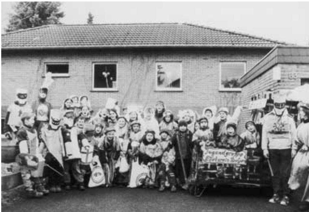
OG Roetgen. Mit solchen Aktionen dokumentiert der Eifelverein, dass er durchaus eine attraktive Alternative für Jugendliche sein kann.

beachteten Blickfang im Roetgener Rosenmontagszug. Die Kostüme für ihren Auftritt als Ritter und Burgfräulein hatten sie in vielen Gruppenstunden unter der Anleitung ihrer BetreuerInnen selbst gebastelt.