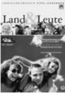
Landerlebnismagazin „Land & Leute“ präsentiert alle Initiativen unter „NatUrlaub bei Freunden“.