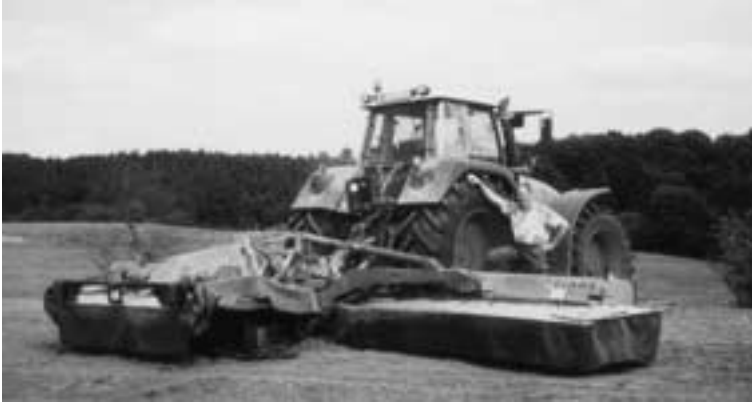
Dieser Traktor von 280 PS und der 8 m breite Apparat zum Grasmähen gehören einem Lohnunternehmen, das drei Landwirte gemeinsam betreiben.

Dabei hilft die Elektronik, die auf einem Bauernhof, wie überall, unentbehrlich ist. Auch die Rückgewinnung von Wärme aus der Milch zur Bereitung von heißem Wasser ist heute normal. Ein solcher Betrieb ist keine Massentierhaltung, es ist einfach ein moderner Bauernhof, der sich den Gegebenheiten anpassen musste, um rentabel zu bleiben.