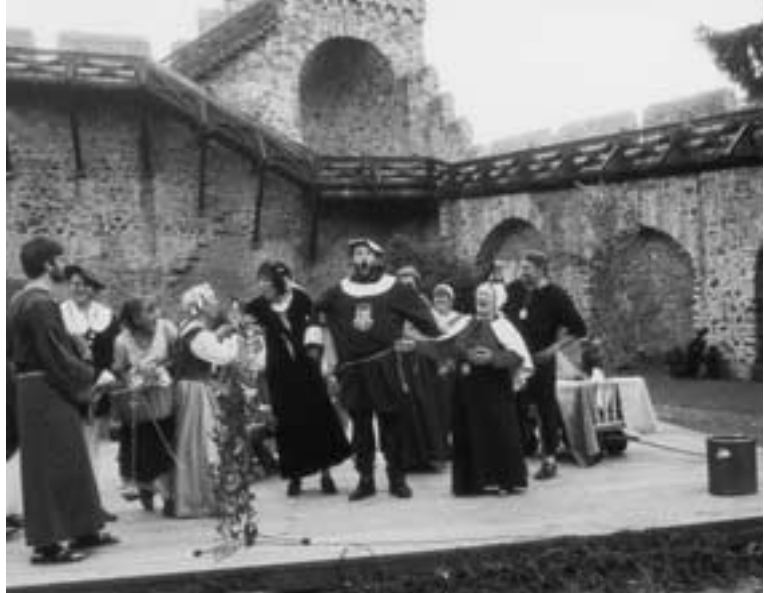
OG Hillesheim. Mit Eifer bei der Sache: die neue Laienspielgruppe des Eifelvereins Hillesheim.

knechte sowie Durchreisende und königlich preußische Beamte mal derb, mal heiter aufstehen.