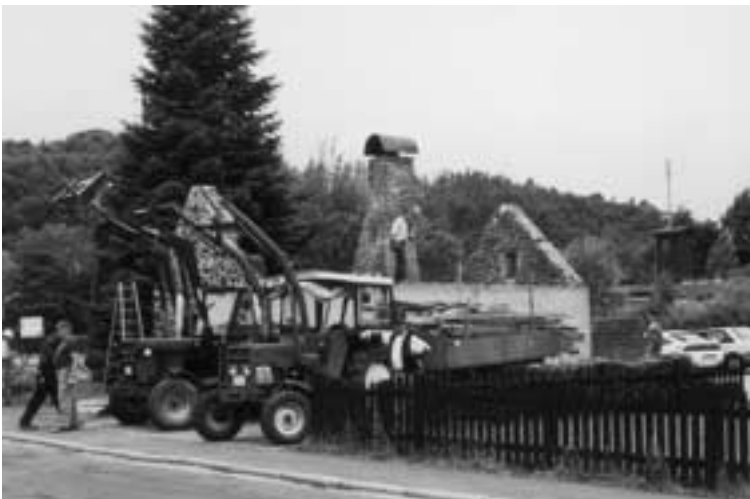
OG Gillenfeld. Vorbildliches im Bereich der Kulturpflege leisten die Gillenfelder Eifelreunde beim Wiederaufbau ihres Backhauses.

Derzeit wird das neue Stück „Wo bleibt denn nur die Postkutsche?“ eingeübt. Die ehemalige Hillesheimer Posthalterei lässt in der Mitte des 19. Jahrhunderts Auswanderer, fahrende Händler, Pferde- und Holz-