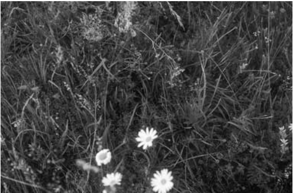
Artenreiches Magergrünland ist in der Eifel auch heute noch weit verbreitet, aber von Nutzungsaufgabe bedroht.

Im Interesse einer gesicherten Nahrungsmittelversorgung dominierte im Bereich der Bodennutzung der Ackerbau trotz der hierfür in weiten Teilen