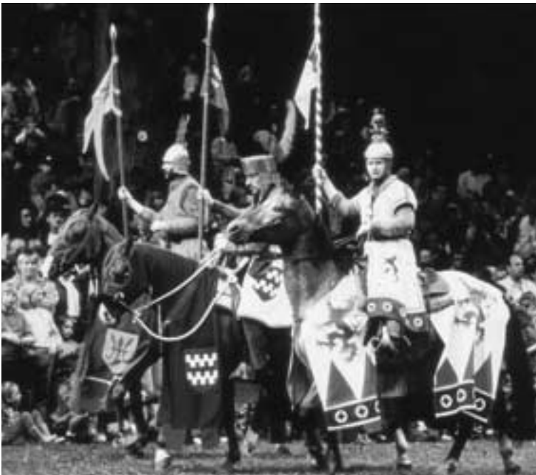
Manderscheid. Sie reiten wieder. Die Ritter aus nah und fern geben sich auf der Turnierwiese der Niederburg ein Stelldichein.

Infos: Kurverwaltung Manderscheid, Tel.: 0 65 72/92 15 49, Fax: 0 65 72/92 15 51, E-Mail: manderscheid@eifelportal.de