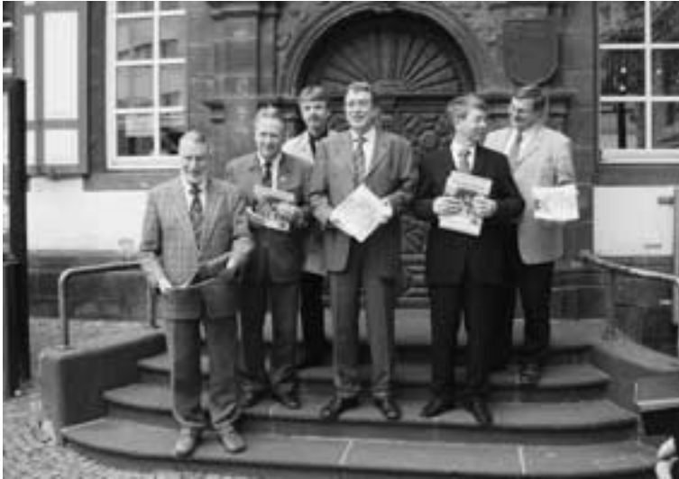
Mayen. Diese Herren werden sich alsbald auf den Sattel schwingen, um die neue Radroute von Koblenz bis Trier abzuradeln.

Die Route ist beschrieben in der Radwanderbrochure „Eifel-Mosel-Route Koblenz-Trier“, die kürzlich in Trier und Mayen der Öffentlichkeit vorgestellt worden ist.