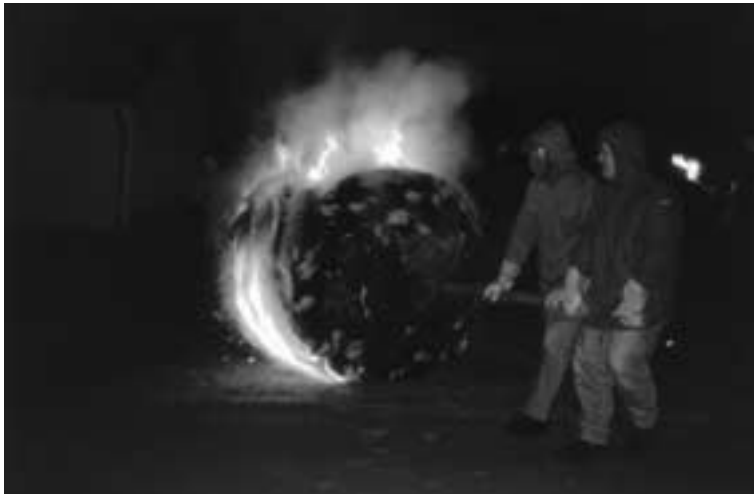
OG Steffeln. Viel Kraft und Mut bewiesen die Steffeler Junggesellen beim Rollen des Feuerrades.

Bis vor gut fünfzig Jahren wurden am „Scheifsonnich“ auch in Steffeln brennende Räder vom Steffelberg zu Tal gerollt.