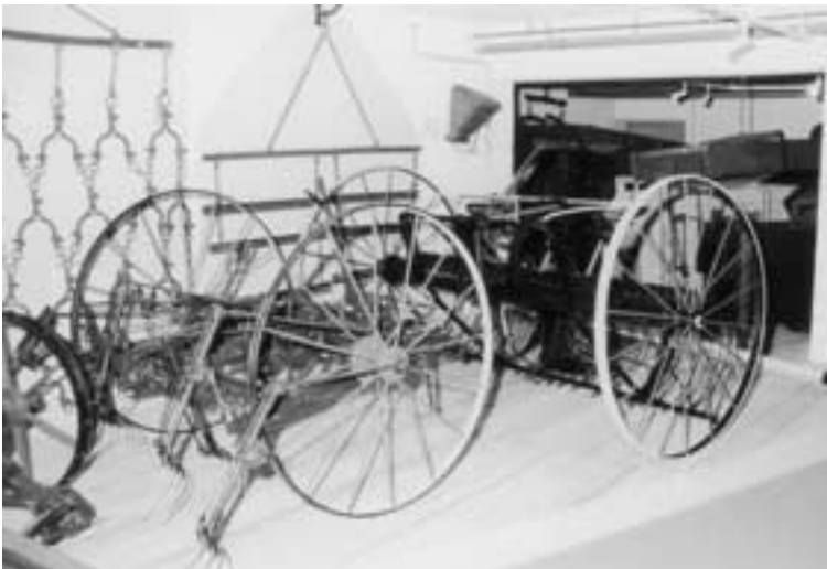
Gabelwender und Pferderechen brachten eine wesentliche Erleichterung bei der Heuernte.

Fast bis zum Ende des 19. Jahrhunderts arbeiteten die Bauern mit den Hilfsmitteln, die schon die Ur ahnen einsetzten. Dieses war das Gerät, das von altersher bekannt war und womit der Einzelne