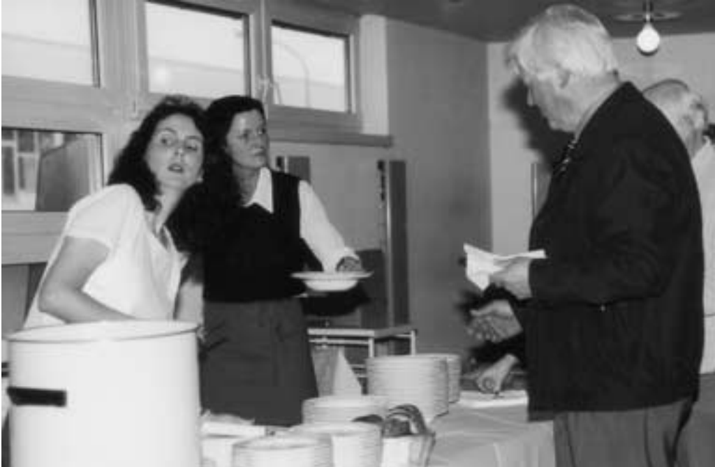
Gerolstein. Wer viel arbeitet, soll auch gut essen.